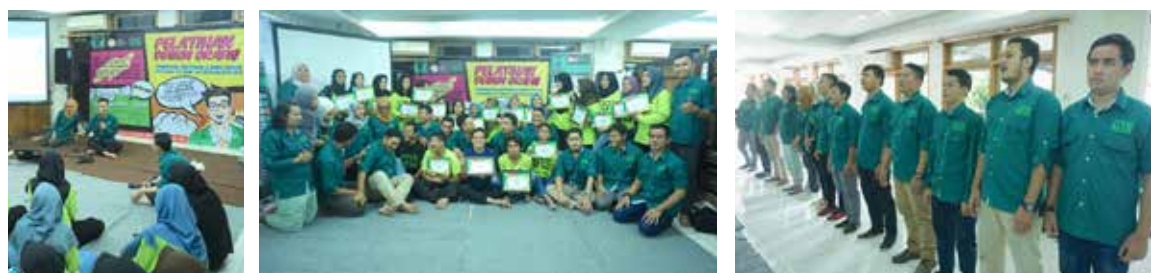
2 Juni 2018, MY YBKB "Pelatihan Desain Grafis"