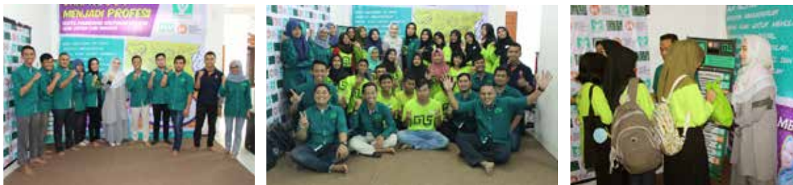
29 Juli 2018, MY YBKB "Dari Hobby Menjadi Profesi"