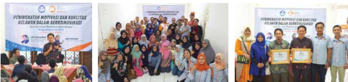
30 September 2018, Seminar Peningkatan Motivasi dan Kualitas Relawan dalam Berkomunikasi bersama Kemendikbud di GCM