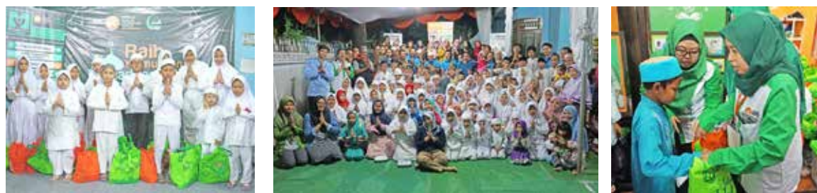
2 Juni 2018, Acara Puncak Raih Kemuliaan Ramadhan 1439H