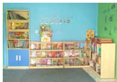
11 Juli 2018, Peresmian TBK Manggarai RW6 dengan Sinarmas