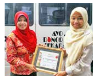
13 Agustus 2014, Aksi Donor Darah di Graha Cerdas Mandiri, Condet, Jakarta Timur. Kegiatan ini merupakan salah satu agenda dalam rangkaian program "Pemeriksaan Kesehatan dan Santunan Untuk 50 Adik Rumah Belajar Kita."