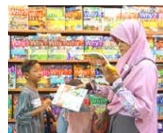
15 Juli 2018, Belanja Buku Bersama Adik - adik Rumah Belajar Kita di Gramedia Matraman Sesi Kedua