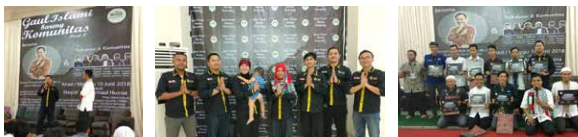
10 Juni 2018, KTMU ikut serta dalam acara "Gaul Islami Bareng Komunitas Part 2"