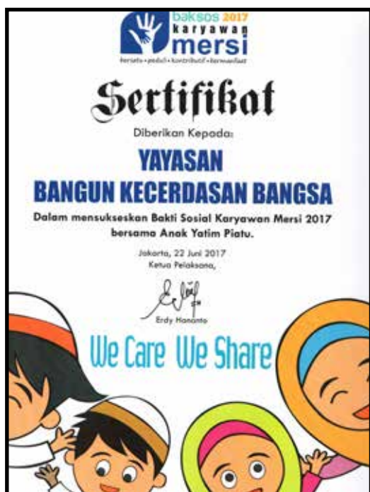
Kerjasama Bakti Sosial YBKB dengan Karyawan MERSI 22 Juni 2017