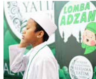
12-18 Juni 2017 acara Santunan Akbar Berkah Ramadhan bersama Yatim selama 7 hari meliputi kegiatan santunan yatim dan dhuafa, lomba tahfiz, mewarnai tumbler, baca puisi, adzan untuk anak yatim, tausiyah oleh Kak Angga disertai buka puasa bersama.