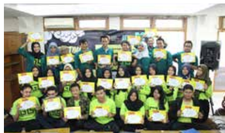
24 Juni 2018, MY YBKB "Pelatihan Microsoft Office"