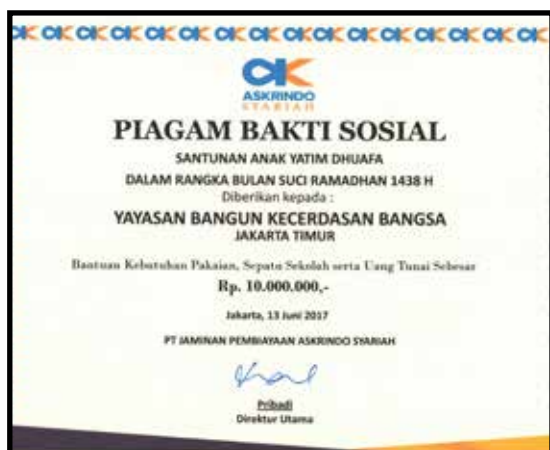
Kerjasama Bakti Sosial YBKB dengan PT. Jaminan Pembiayaan Askrindo Syariah dan PT. Mersifarma TM