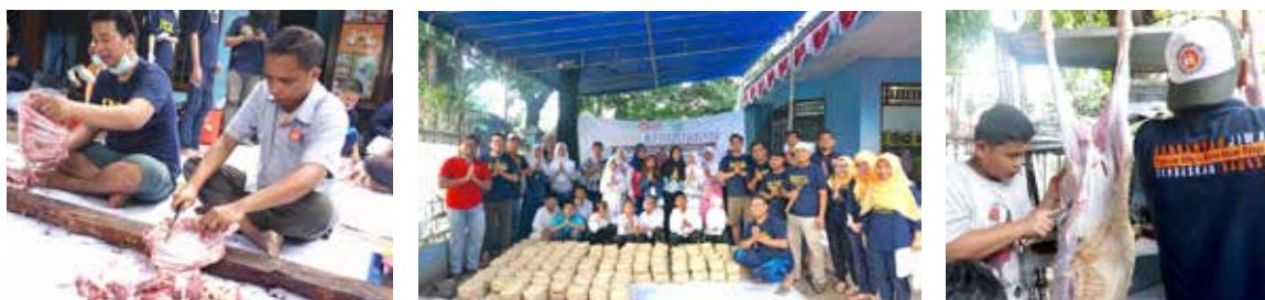
24 Agustus 2018, Qurban 1439H