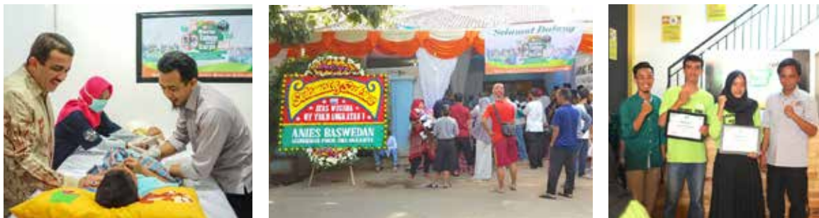
29 Desember 2018, Acara Khitanan Massal dan Santunan 105 Yatim Dhuafa serta Wisuda Mandirikan Yatim Angkatan 1 sebanyak 30 Peserta dihadiri Wali Kota Jakarta Timur.