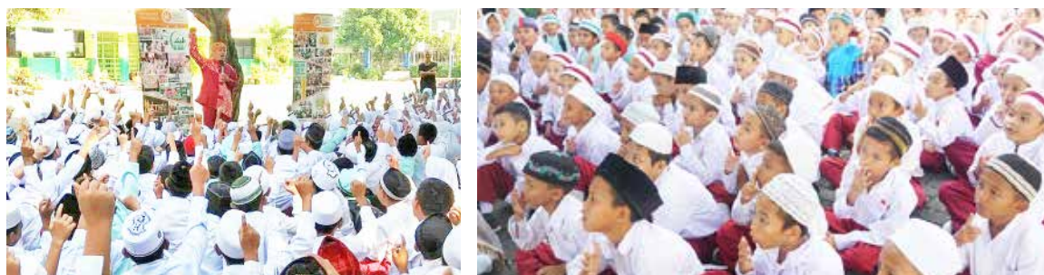
16 Maret 2018, Dongeng Roadshow SDN 08 Batu Ampar