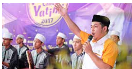
Santunan Akbar Cinta Nabi Cinta Yatim 29 Januari 2017

Majelis Al Balad mempunyai Kegiatan Rutin berupa Santunan Yatim dan Dhuafa yang dilakukan rutin setiap minggunya yang dilaksanakan pada hari Ahad Ba'da Ashar. Dan juga Santunan Akbar yang dilakukan dalam rangka memperingati hari-hari besar Islam. Kegiatan ini juga merupakan bentuk komitmen dari program-program Yayasan Bangun Kecerdasan Bangsa di bidang sosial dan keagamaan.