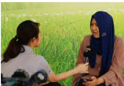
Agustus 2017, liputan live DAAI tv di Rumah Belajar Kita (RBK) dalam rangka memperkenalkan program Kelas Belajar titik Kramat Jati dan program Pojok Baca Gemari Bacaku.