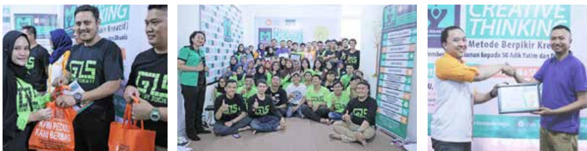
1 April 2018 , MY YBKB "Pelatihan Berfikir Kreatif"