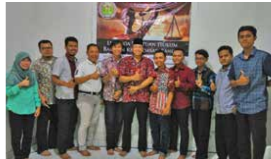
Pengesahan Lembaga Bantuan Hukum Bangun Kecerdasan Bangsa dan Pelatihan Hukum Bagi Paralegal 4-5 Juni 2016