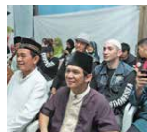
19 Juni 2016, acara Santunan Akbar Berbagi Berkah Rezeki Melimpah ke-I dihadiri artis komedian Ginanjar dan Gary Iskak.