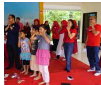
Sabtu tanggal 19 Agustus 2017, Kolaborasi DEC ( Diaspora E-class) dengan RBK ( Rumah Belajar Kita) di Kramat Jati.