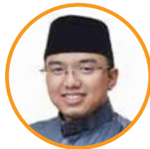
H. Amsori, S.H. MH. MM.