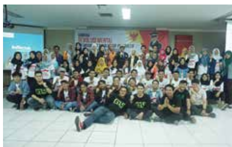
29 Desember 2017, Acara Seminar Revolusi Mental diisi oleh Kapten Sar yang dilaksanakan Goodlife Society bekerja sama dengan Kemenpora di gedung STBA Pertiwi.