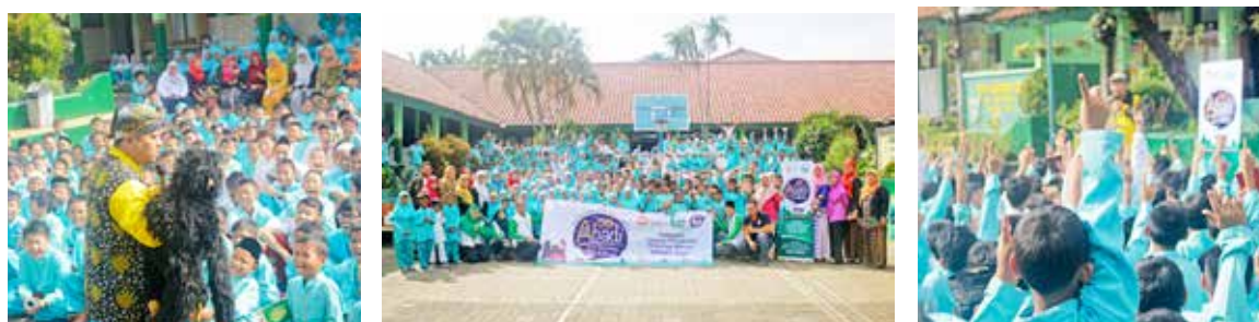
23 maret 2018, Dongeng Roadshow SDN 08 Gedong