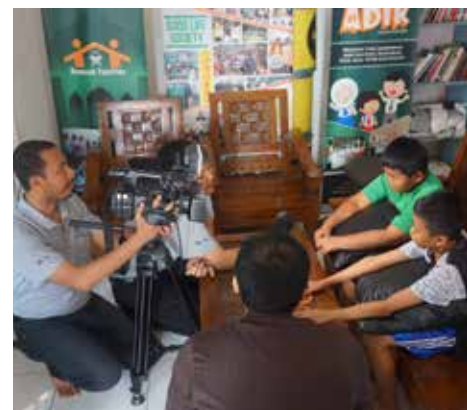
Senin tanggal 18 September 2017, liputan live YBKB memperkenalkan program Anak Didik (ADIK) dan Asrama Yatim di DAAI tv dalam acara HALO Indonesia.