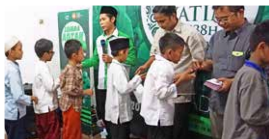
Santunan Akbar Berkah Ramadhan bersama Yatim 12-18 Juni 2017