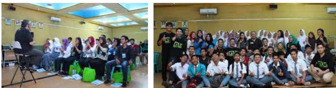
18 November 2017 hari pertama program Mandirikan Yatim (MY YBKB) berupa pelatihan pengenalan diri dan goal setting oleh Goodlife Society dan NAC yang dilaksanakan di SMAN 104 Jakarta.