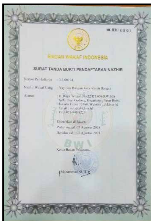
27 September 2018, YBKB Resmi Terdaftar Sebagai Nadzir di Badan Wakaf Indonesia