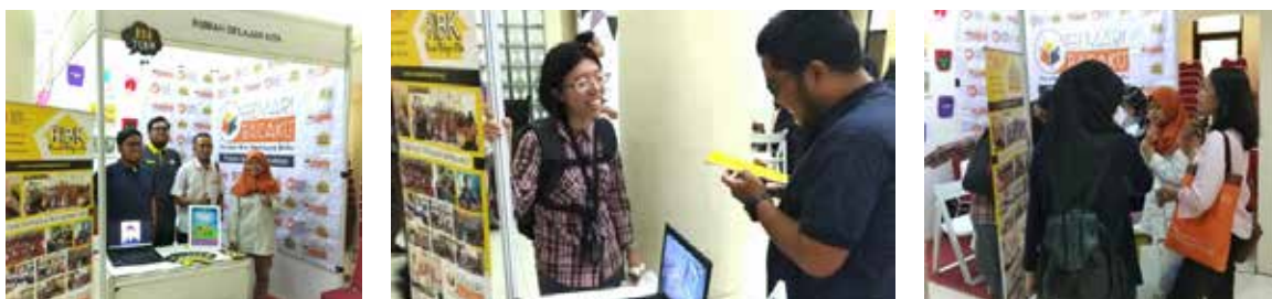
19 September 2018, Open Booth Rumah Belajar Kita di Balai Sidang Universitas Indonesia