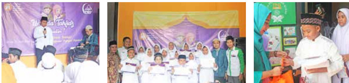
2 Mei 2018 Wisuda Tahfiz