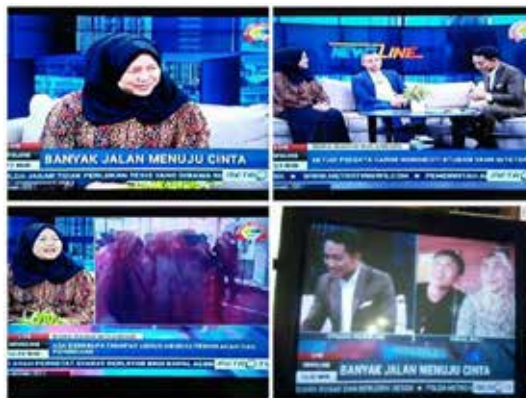
KTMU diundang sebagai narasumber oleh Metro TV dalam program Newsline.

Komunitas Ta'aruf yang bertujuan menciptakan keluarga Sakinah, Mawaddah, Warahmah dalam masyarakat.