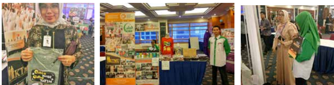
29 Agustus 2017, Majelis Al Balad menjual kaos "Cinta Nabi Cinta Yatim" dan Thumblar karya adik-adik yatim binaan YBKB dalam acara Bazaar yang diadakan di Menara Mandiri.