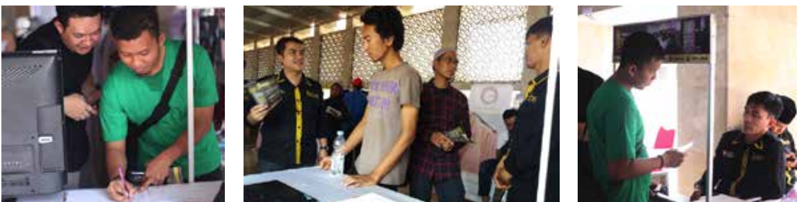
6 Oktober 2018, Open Booth KTMU acara YFest bertempat di Masjid Istiqlal