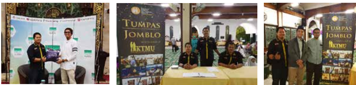
20 Oktober 2018, Open Booth KTMU acara Jomblo di Masjid Agung Sunda Kelapa