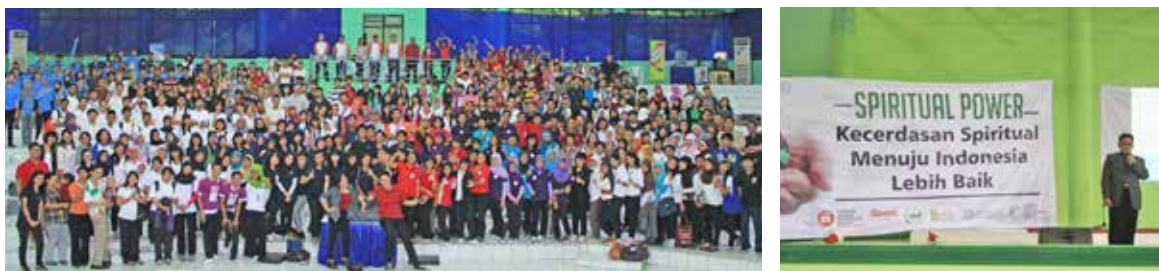
Silaturahmi relawan Yayasan Bangun Kecerdasan Bangsa di Auditorium Ragunan