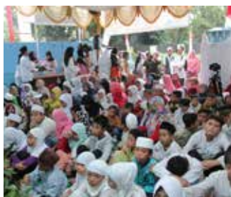
Santunan Akbar Berbagi Berkah Rezeki Melimpah 19 Juni 2016