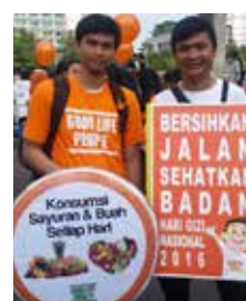
Minggu, tanggal 30 Januari 2016 BJSB Goodlife Society ikut berkolaborasi dengan 7 Lembaga (Kemenkes RI, Ikatan alumni, unit kegiatan mahasiswa (ukm), dan komunitas dalam kegiatan Hari Gizi Nasional 2016 di Car Free Day , Sudirman HI.