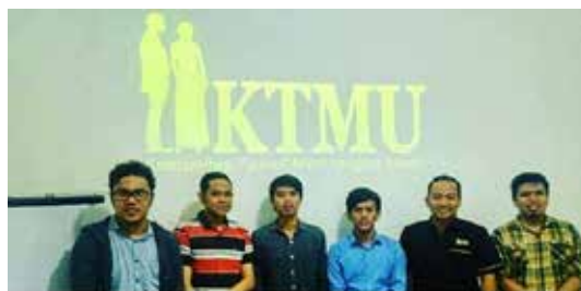
Para peserta interview KTMU.