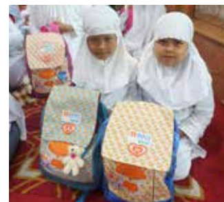
22 Desember 2017, Adik-adik Binaan YBKB Sebanyak 177 Yatim dan Dhuafa Mendapat Undangan dari BNI Syariah.