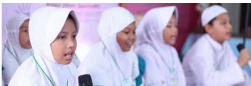
Santunan Akbar Berbagi Berkah Rezeki Melimpah II 30 Oktober 2016