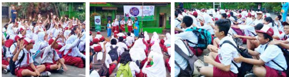
10 April 2018 , Dongeng Roadshow SDN 01 dan SDN 012 Gedong