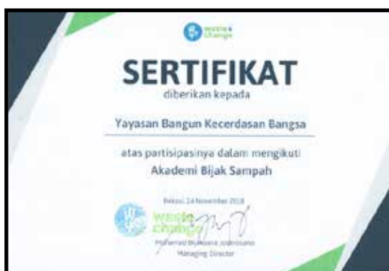
Komunitas Goodlife Society (GLS) berpartisipasi dalam Akademi Bijak Sampah 2018 bersama waste4change di Bekasi