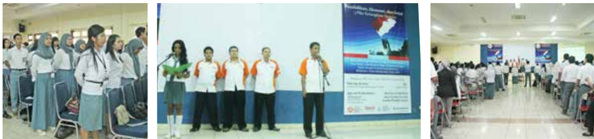
Silaturahmi relawan Yayasan Bangun Kecerdasan Bangsa dalam memperingati Hari Kebangkitan Nasional