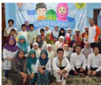
Santunan Akbar Semangat Berbagi 6 Juli 2014