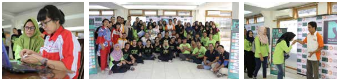
25 Februari 2018 , Pelatihan Analisa Potensi Bakat