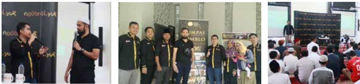
16 September 2018, Open Booth KTMU di acara Izinkan Aku Mengenalmu di Masjid Ash Shaff Emerald Bintaro bareng Teuku Wisnu