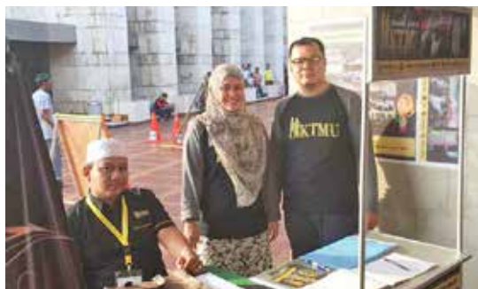
KTMU berpartisipasi dalam Youth Islamic Festival (YIFEST) di Masjid Istiqlal.