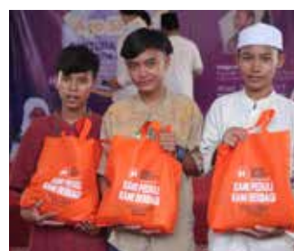
Santunan Akbar Ayo Sholat 23 April 2017 di RPTRA Kelurahan Gedong Jakarta Timur