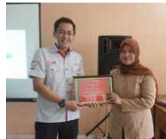
29 November 2017, Goodlife Society Melaksanakan Program NAC dan Pengadaan Fasilitas Olahraga Bersama Indosurya di SMK Yasda Kuningan.