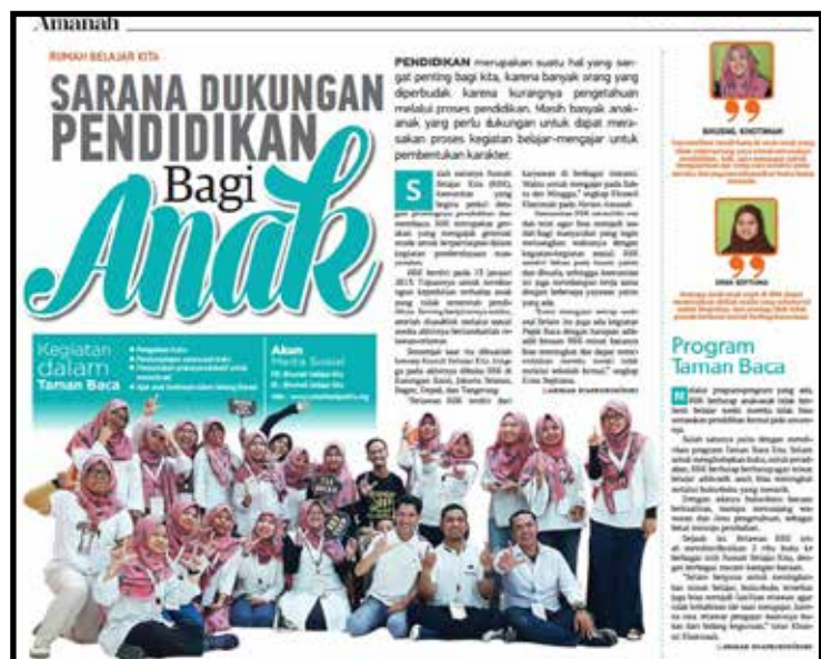
Liputan Koran Amanah mengenai program Gemari Bacaku Rumah Belajar Kita (RBK).