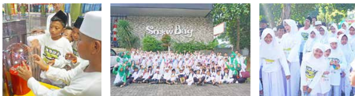
25 Februari 2018, Wisata bersama Yatim dan Dhuafa di TMII