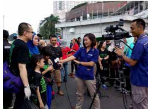
Liputan Goodlife Society Program BJSB di Car Free Day oleh Metro TV