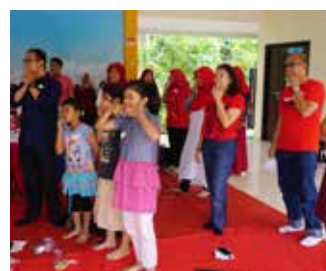
19 Agustus 2017, Kolaborasi DEC (Diaspora E-class) dengan RBK (Rumah Belajar Kita) di Kramat Jati.