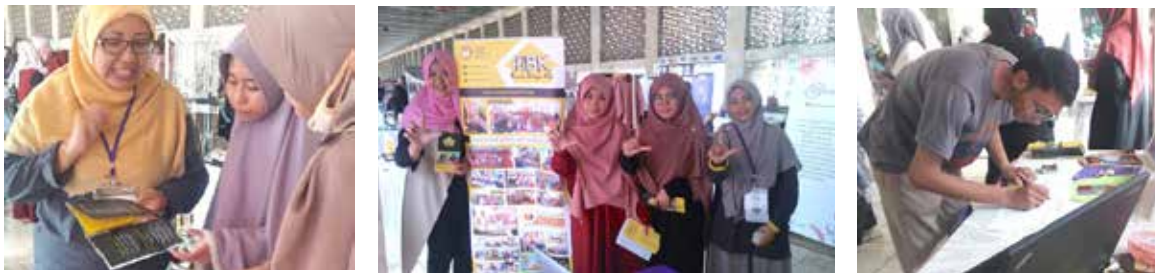
6 Oktober 2018, Open Booth RBK acara YFest bertempat di Masjid Istiqlal