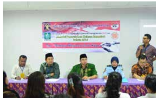
Penyuluhan Hukum di Lapas Cipinang dan Pondok Bambu di tahun 2016.