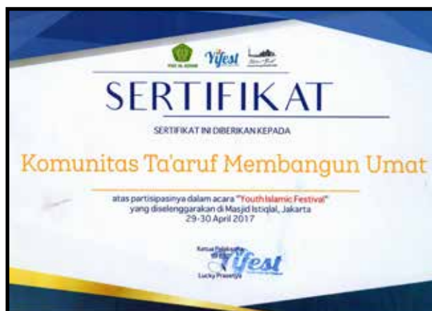
Komunitas Taaruf Membangun Umat (KTMU) berpartisipasi dalam Event Youth Islamic Festival 2017 yang diselenggarakan di Masjid Istiqlal.