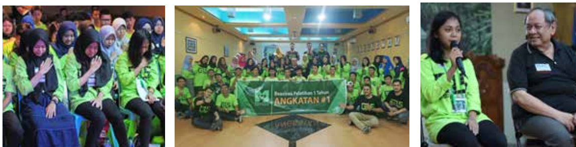
19 November 2017 hari kedua program Mandirikan Yatim (MY YBKB) berupa pelatihan pengenalan diri dan goal setting oleh Goodlife Society dan NAC yang dilaksanakan di SMAN 104 Jakarta.