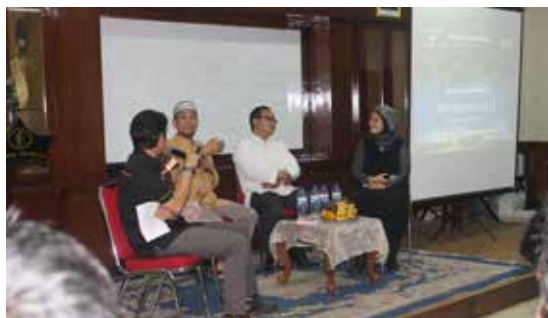
Suasana seminar Pranikah di SMKN 57 Ragunan yang diselenggarakan KTMU dan dihadiri oleh 100 orang.

KTMU berbeda dengan Biro Jodoh lainnya karena mengadakan pembinaan pra ta'aruf, ta'aruf, dan pasca nikah yang rutin diadakan minimal satu bulan sekali. Selain itu juga KTMU mengadakan sosialisasi berupa acara seminar pra ta'aruf yang mengundang Ustadz, Motivator, ataupun penulis buku sebagai pembicara. Sampai saat ini KTMU sudah berhasil memasangkan kurang lebih 100 pasangan hingga menikah.