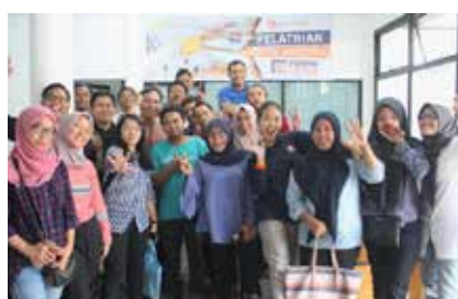
29 Juli 2018, Pelatihan Digital Marketing oleh Ruang Cerdas Sesi Pertama