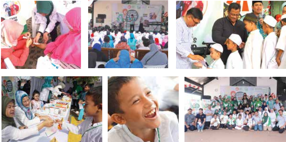
7 Oktober 2018, Santunan Akbar dan Pemeriksaan Kesehatan Gratis 200 Anak Yatim di RPTRA Gedong