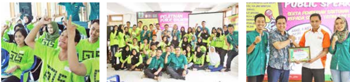
6 Mei 2018, MY YBKB "Pelatihan Public Speaking"