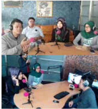
Liputan Goodlife Society di Women Radio