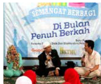
6 Juli 2014, acara Santunan Akbar Semangat Berbagi di Bulan Penuh Berkah Ramadhan dengan kegiatan buka puasa bersama anak didik dari RBK dan silaturahmi para relawan RBK.