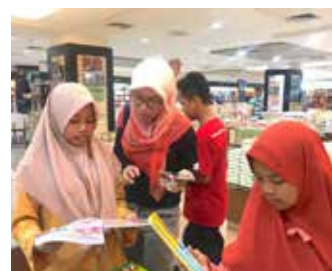
8 Juli 2018, Belanja Buku Bersama Adik - adik Rumah Belajar Kita di Gramedia Depok Sesi Pertama