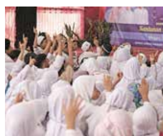
29 Januari 2017, acara Santunan Akbar Cinta Nabi Cinta Yatim meliputi kegiatan santunan yatim, penampilan hadroh, tausiyah oleh Ustad Udjae.