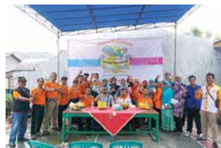
28 Januari 2018, Peresmian TBK Kebayoran Lama.